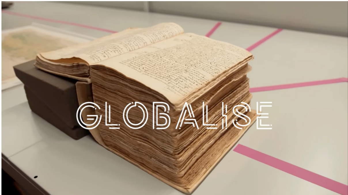
Afb. 3: Still uit de GLOBALISE-introductievideo ( https://youtu.be/FQyxjYGr6XY ) die een bundel met VOC-documenten toont.