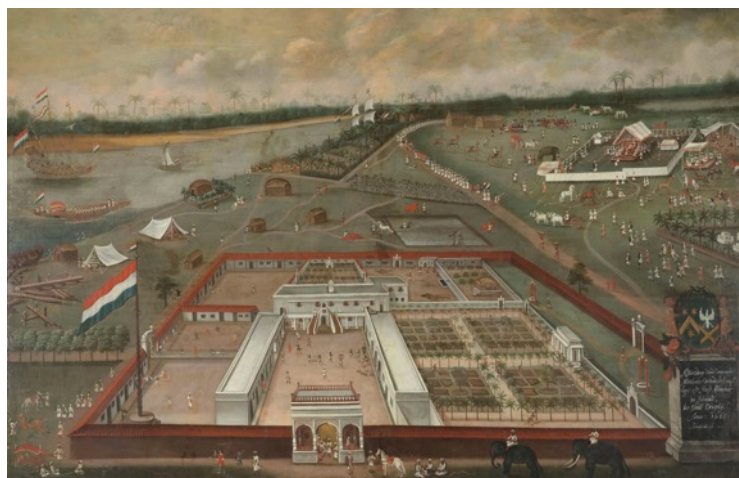
Afb. 1: Schilderij van de handelsloge van de VOC in Hougly in Bengalen (India). Op de rivier zijn VOC-schepen te zien. Rechts gaan Nederlanders op bezoek bij een lokale vorst. (Hendrik van Schuylenburgh, 1665, Rijksmuseum Amsterdam, CCO)

Batavia (het huidige Jakarta, Indonesië) was het hoofdkwartier van de VOC in Azië. Daar zetelde de gouverneur-generaal die vanuit de verschillende factorijen op de hoogte werd gehouden over alles wat er speelde in het enorme gebied waar de VOC actief was: aankomende en vertrekkende schepen, lokale ceremonies, ontwikkelingen op diplomatiek gebied, opstanden, oorlogen, noem maar op. Kopieën van al deze correspondentie werden overgestuurd naar het VOC-bestuur in Nederland.